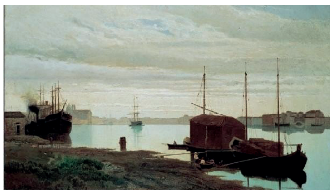
Guglielmo Ciardi, Canale della Giudecca (1868)