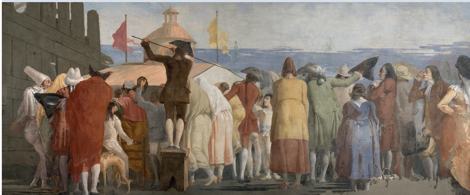
Giandomenico Tiepolo, Il Mondo Novo